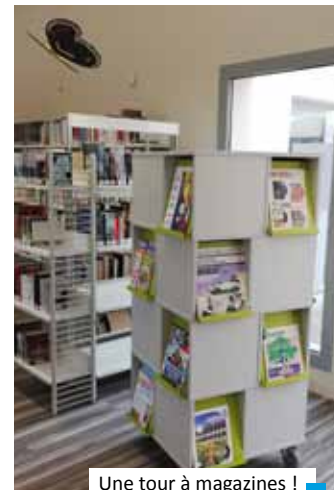
Une tour à magazines !

La consultation des magazines sur place est gratuite, l'emprunt est aux mêmes conditions que pour les livres : inscription gratuite pour les enfants, cotisation annuelle de 10€ pour les adultes (sauf étudiants, chômeurs, apprentis).