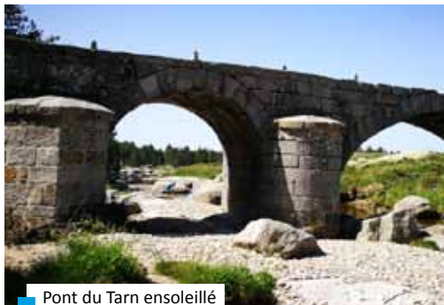
Pont du Tarn ensoleillé