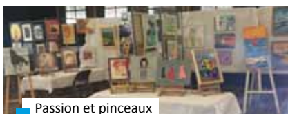
Passion et pinceaux