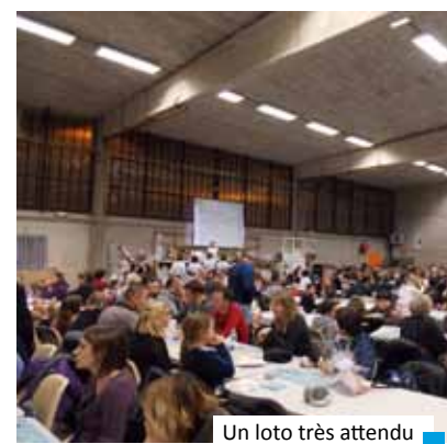
Un loto très attendu

N'hésitez plus pour vous joindre à nous si vous aussi vous souhaitez soutenir les divers projets pour nos bambins. Pour tous renseignements, vous pouvez nous contacter par mail : lasourisverte.chatu@gmail.com