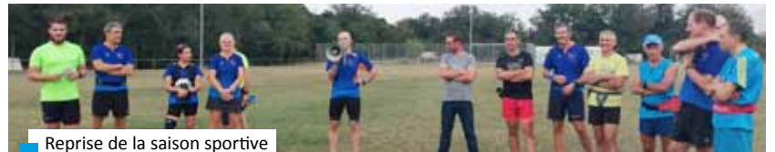
Reprise de la saison sportive

C'EST LA RENTRÉE POUR L'ATHLÉ LOISIR PIZANÇON !