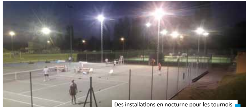
Des installations en nocturne pour les tournois