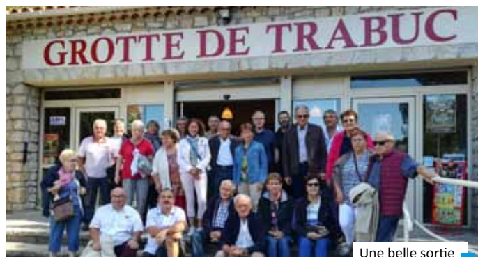
Une belle sortie