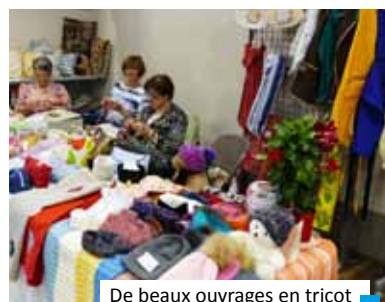
De beaux ouvrages en tricot

En juin, nous avons clôturé l'année par une sortie pédagogique à Ardelaine, sur la commune de Saint-Pierreville en Ardèche. Le matin : visite guidée pour connaître tous les secrets de la laine de la tonte des moutons, au cardage, au filage... À midi : le repas, servi sur place et concocté avec des produits du terroir, a régalé tout le monde. Puis un stage d'initiation au feutrage de la laine nous a été proposé et nous sommes toutes reparties avec l'ouvrage confectionné. D'autres ont préféré visiter les bâtiments et outillages de production. Nous étions tous enchantés de cette journée de découverte.