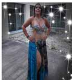
Pour plus d'infos : 06 84 94 32 78

Samedi 7 septembre de 13 h 30 à 17 h 30 ....