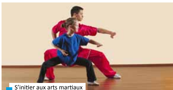
S'initier aux arts martiaux

L'association HONGJIA WUSHU - Arts Martiaux Chinois vous propose cette année :