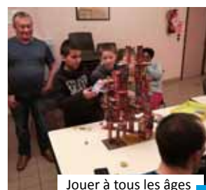
Jouer à tous les âges

La rentrée démarre fort ! Après le Forum des associations, les soirées jeux ont repris le vendredi 13 septembre avec une belle participation. Des habitués, mais aussi des nouveaux joueurs qui sont venus grossir les rangs pour tester les dernières acquisitions de l'association, et de ses membres, tel que « Tiny Epic Defender » ou encore « Hit'z Road ».