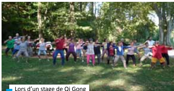
Lors d'un stage de Qi Gong

04 75 47 25 51 - amitc@orange.fr www.taichichuanromans.com