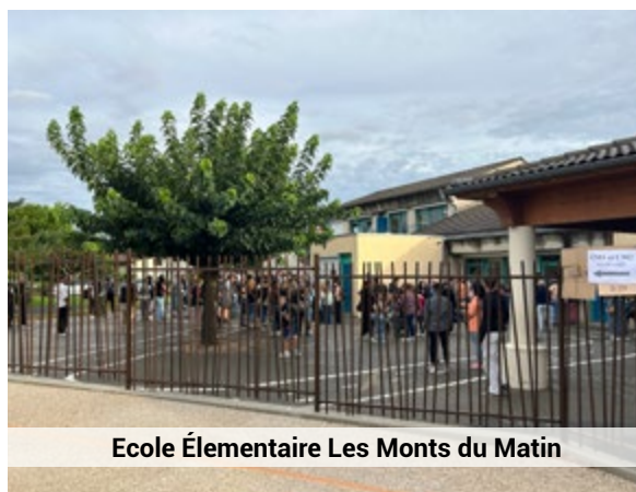
Ecole Élémentaire Les Monts du Matin