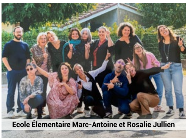
Ecole Élémentaire Marc-Antoine et Rosalie Jullien