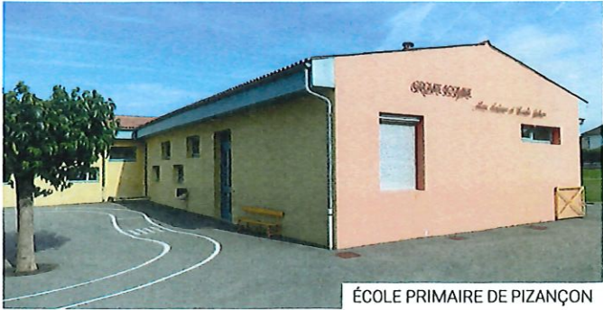
ÉCOLE PRIMAIRE DE PIZANÇON